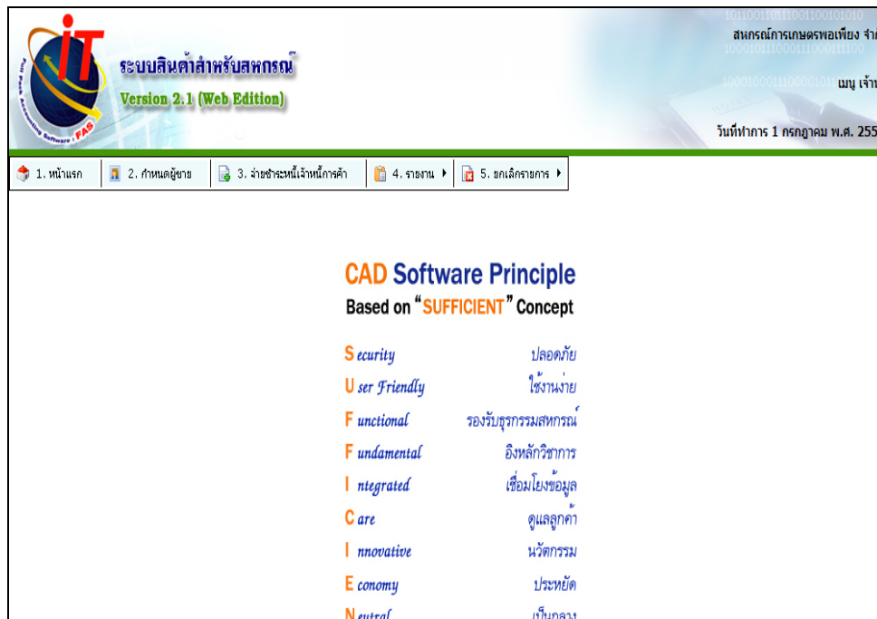
รูปที่ 4-1 การจัดการเจ้าหน้าที่

เป็นเมนูที่เกี่ยวข้องกับการจัดการเจ้าหน้าที่ เมื่อเข้าเมนู จะปรากฏหน้าจอดังรูปที่ 4-1 การจัดการเจ้าหน้าที่